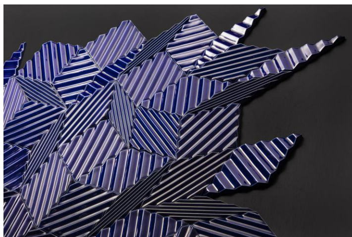
(図版1) RHOMBUS WORKS [JAGGED] 部分 野老朝雄、2020、タイル、 1辺100mm

株式会社 LIXIL が運営する、土とやきものの魅力を伝える文化施設「INAX ライブミュージアム」(所在地：愛知県常滑市)では、2021年4月24日(土)から10月12日(火)まで、展覧会「DISCONNECT/CONNECT【ASAO TOKOLO×NOIZ】幾何学紋様の律動、タイリングの宇宙」を開催します。