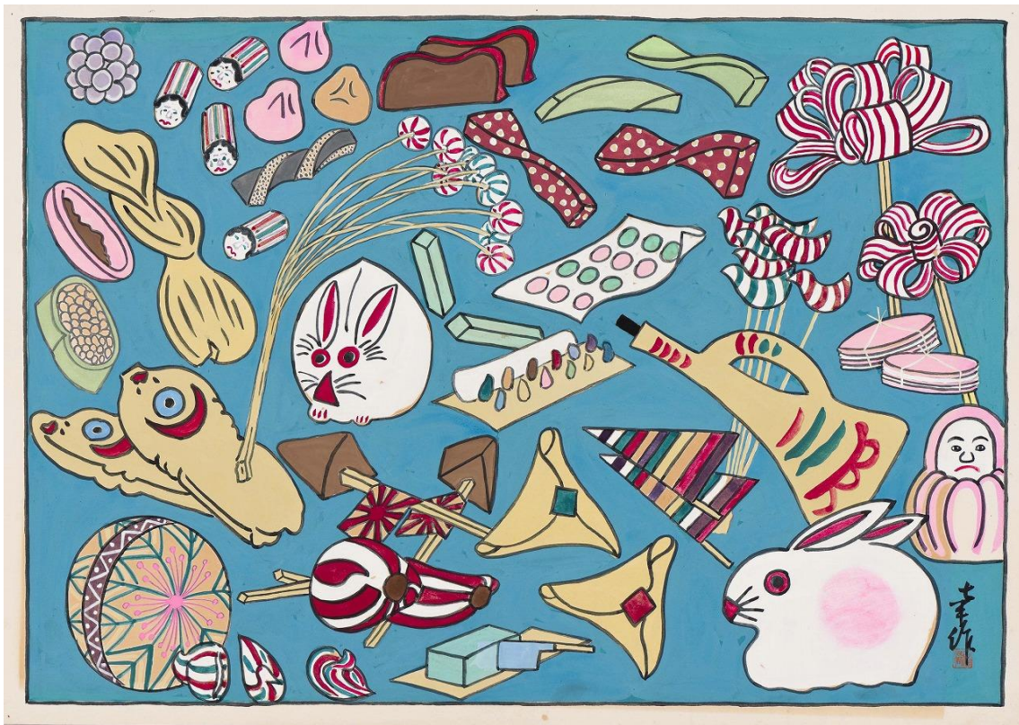
写真1：石橋幸作自筆画 駄菓子風俗図絵「駄菓子さまざま」