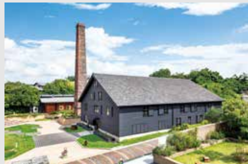
國家指定物質文化遺產，近代化工業遺產

保存和公開展示了大正年代燒製土管的大窯，工房和煙囪。巨大的磚製大窯，用粗木棟梁搭建的外圍工房都堪稱是當時的傑作。在這裡可以看到為日本近代化作出貢獻的製作土管的設備和機械，還可以觀看當時燒窯時珍貴的映像資料。